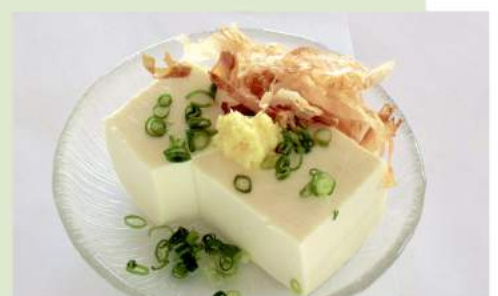
冷奴 360 円