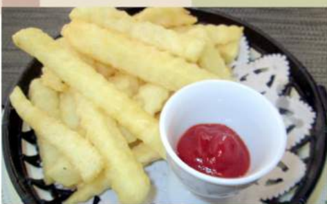
フライドポテト 360 円