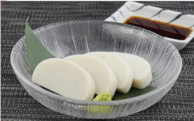
小田原カマボコ 400 円