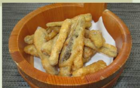
ごぼう唐揚げ 480 円