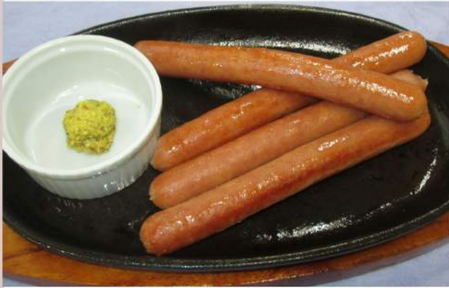
鉄板ウインナー 700 円