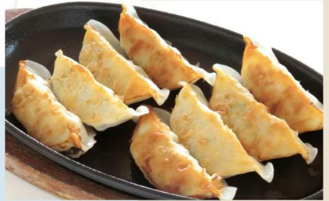
鉄板ギョーザ 670 円