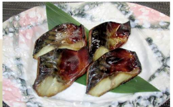
塩麴漬け焼き鯖 700 円