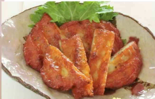
野菜さつま揚げ 580 円