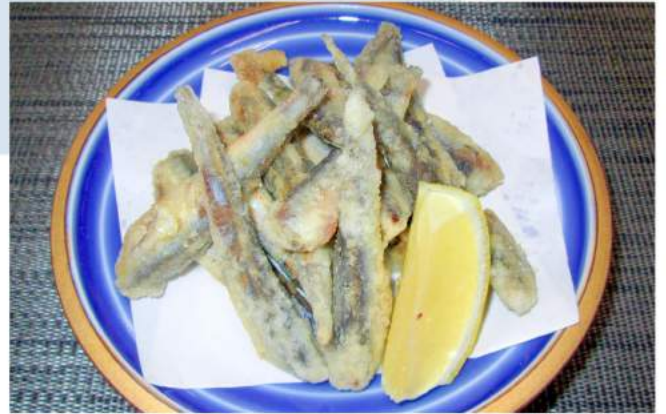
いわし唐揚げ 600 円